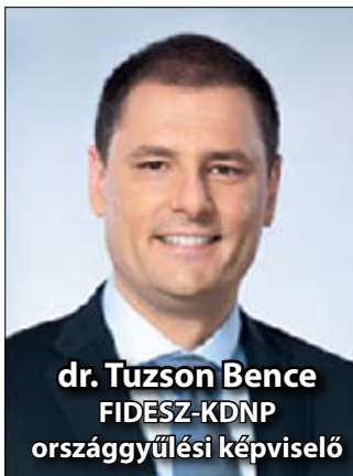
dr. Tuzson Bence FIDESZ-KDNP országgyűlési képviselő