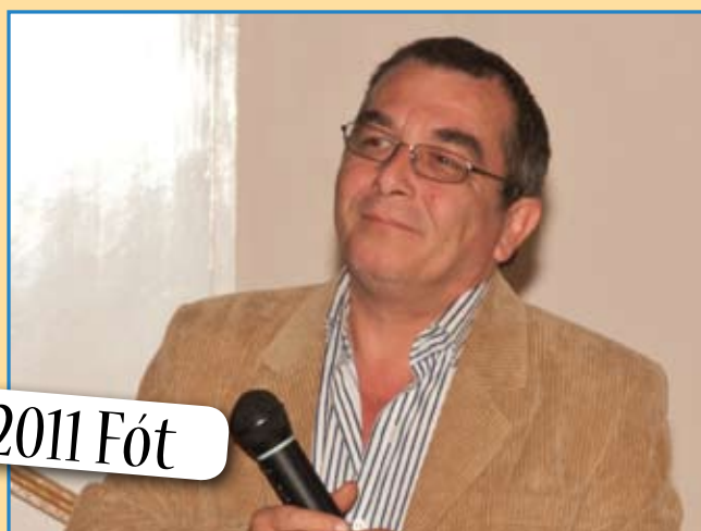
Vadászbál 2011 Fót