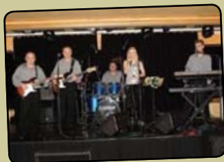
Derby Dance Band