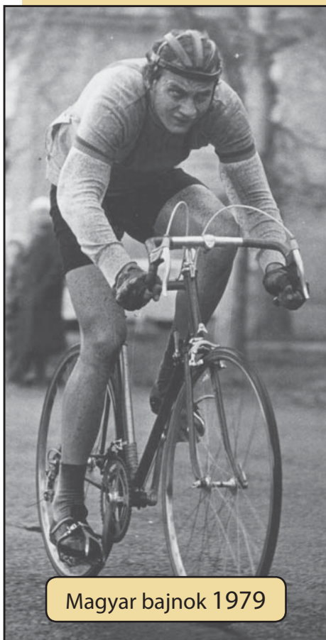
Magyar bajnok 1979