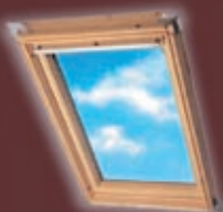
VELUX Tetőtéri ablakok

Tel:(27)360-467 Mobil:(30)449-4591, (30)241-1655