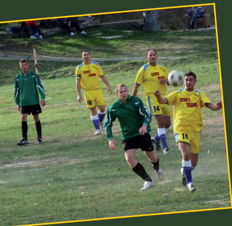
A megyei II. osztály Vésnök-csoportjának állása a 4. forduló után