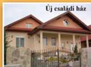
Új családi ház

Hivatalos értékbecslést Adásvételi szerződések készítését, ügyvédi közreműködéssel Földhivatali ügyintézés