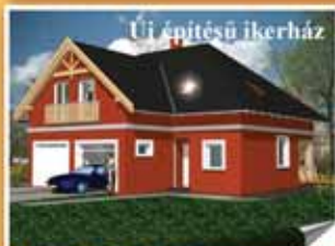
Új építésű ikerház

Fóton csendes aszfaltút mellett, jó közlekedéssel, 100 m 2 parkosított telken 70m 2 alapterületű, nappali+2 hálószoba öszkomfortos, hangtalan szőnyeg felújított parasztház jellegű családi ház beépített konyhával, + 25m 2 garazzal, fűt kúttal. Irányár 19,3 mFt