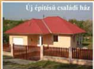
Új építésű családi ház

Veregyház egyik legszebb részén, kiváló közlekedéssel, lakóközvet 119m 2 területű, nappali-amerikai konyha+2,5 hálószoba, 2 fürdőszoba, öszkomfortos modern ikerház garázzal. Céges építkezés, ezért az összes kedvezmény igénybe vehető. Irányár 25,9 mFt