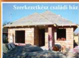
Szerkezetkész családi ház

Figyelem! Óriási áron! Fót külterületen, jól megközelíthető, panorámás 360 m 2 telken 3 szintes, 108m 2 területű, nappali-amerikai konyha+2 hálószoba ház, kőbelsőfalakkal, teraszal. Irányár 14,8 mFt