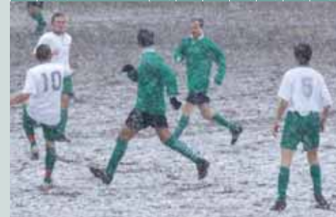
A megyei III. osztály BELUGA SPORT-Gödöllői csoportjának állása a 13. forduló után